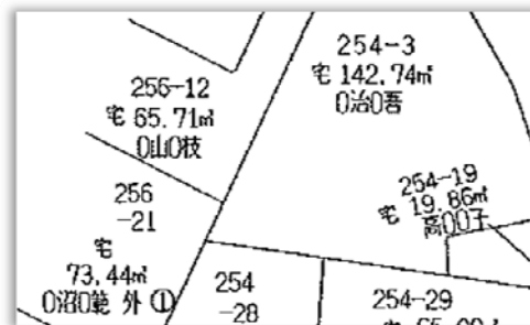
地番情報などを呼出して簡単に配置できる