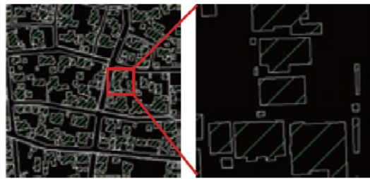
図面の拡大縮小時の描画スピードも大幅アップ！